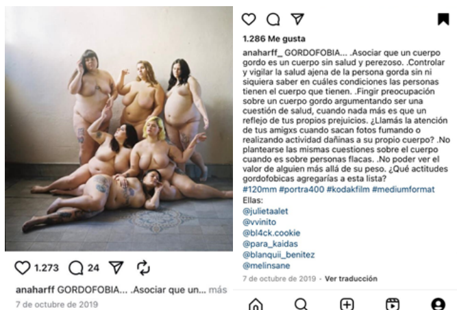
Figura 5. Captura de pantalla realizada por Agustina Lollini Noël el día 4 de abril de 2025. Ana Harff, Instagram, 7 de octubre de 2019. (Posteo de la artista sobre “Gordofobia”).