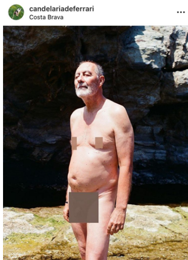
Figura 12. Captura de pantalla realizada por Agustina Lollini Noël el día 16 de agosto de 2023. Candelaria Deferrari Piccione. Captura de pantalla, Instagram, 12 de febrero de 2023. (Fotografía de la serie “Fuerza Bruta”).