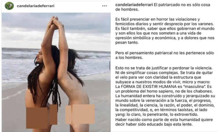
Figura 8. Captura de pantalla realizada por Agustina Lollini Noël el día 4 de abril de 2025. Candelaria Deferrari Piccione, Instagram, 28 de diciembre de 2020 (Posteo sobre el patriarcado con fotografía de la serie “Fuerza Bruta”).