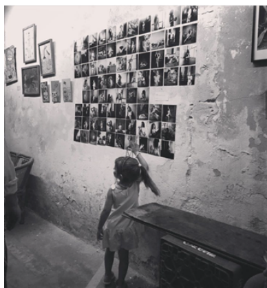
Figura 1. Captura de pantalla realizada por Agustina Lollini Noël el día 11 de mayo de 2023. Ana Harff, Instagram, 13 de marzo de 2023. (Imagen tomada por la artista en la exposición de su serie “Única”).