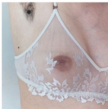
Figura 9. Captura de pantalla realizada por Agustina Lollini Noël el día 16 de agosto de 2023. Irini Iliopulu, Instagram, 20 de diciembre de 2018. (Posteo sobre el vello corporal en las mujeres).