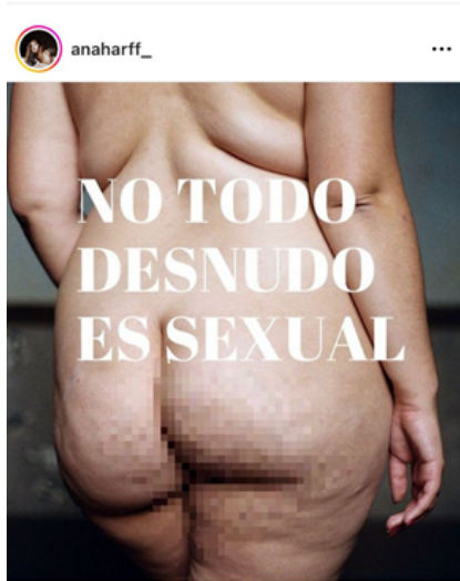
Figura 6. Captura de pantalla realizada por Agustina Lollini Noël el día 16 de agosto de 2023. Ana Harff, Instagram, 22 de junio de 2023. (Imagen de la autora con intervención de texto “No todo desnudo es sexual”).