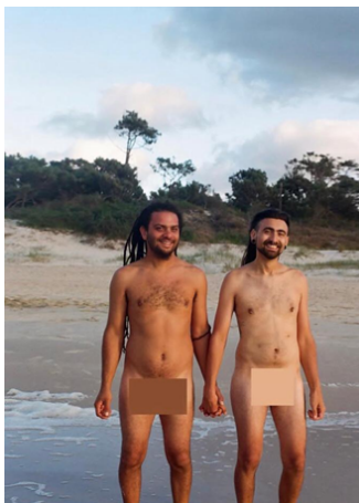
Figura 11. Captura de pantalla realizada por Agustina Lollini Noël el día 4 de abril de 2025. Candelaria Deferrari Piccione, Instagram, 26 de noviembre de 2020. (Fotografía de la serie “Fuerza Bruta”).

tinuación, donde se observan figuras geométricas de colores sobre los pezones y la zona pélvica de los sujetos.