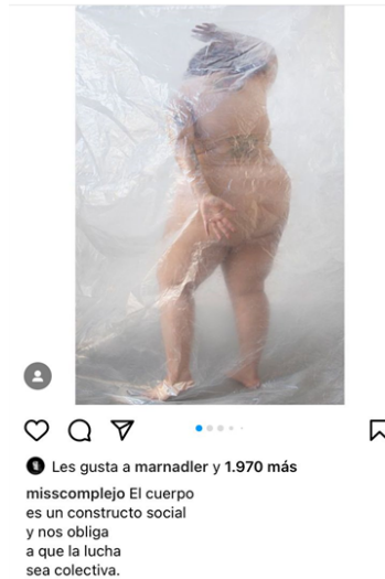
Figura 10. Captura de pantalla realizada por Agustina Lollini Noël el día 16 de agosto de 2023. Nadia Bautista, Instagram, 12 de julio de 2021. (Posteo sobre el rol político del cuerpo).