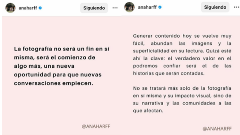
Figura 7. Captura de pantalla realizada por Agustina Lollini Noël el día 11 de mayo de 2023. Ana Harff, Instagram, s.f. (Pertenece a su cuenta original que fue dada de baja por la plataforma).