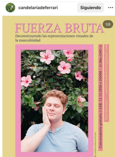
Figura 3. Captura de pantalla realizada por Agustina Lollini Noël el día 16 de agosto de 2023. Candelaria Deferrari Piccione, Instagram, 28 de noviembre de 2020. (Posteo sobre su taller “Deconstruyendo las representaciones visuales de la masculinidad” con imagen de serie “Fuerza Bruta”).