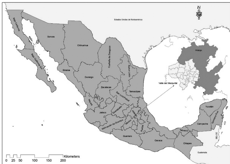
Figura 1: Localización del Valle del Mezquital